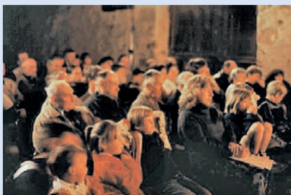
Le Théâtre de l'Agora et la tournée du Théâtre à la Ferme sont soutenus par le Conseil Général (Marne) et le Conseil Régional (Champagne Ardenne)

Seule la qualité d'un spectacle professionnel, adapté à un public "vierge de théâtre" peut nous donner cet espoir.